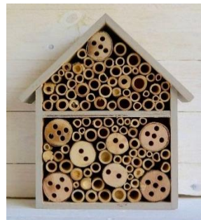
Primjerci različitih inačica hotela za kukce.